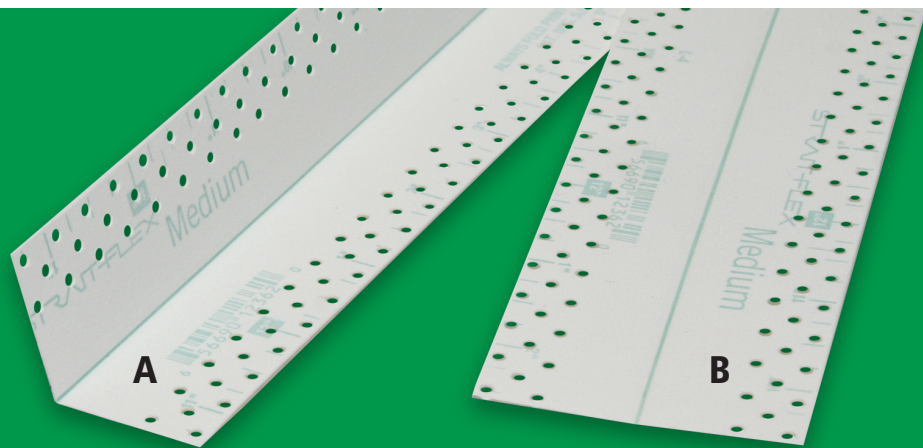
A – Podstawowe zastosowanie: do narożników wewnętrznych B – Dodatkowe zastosowanie: do płaskich połączeń